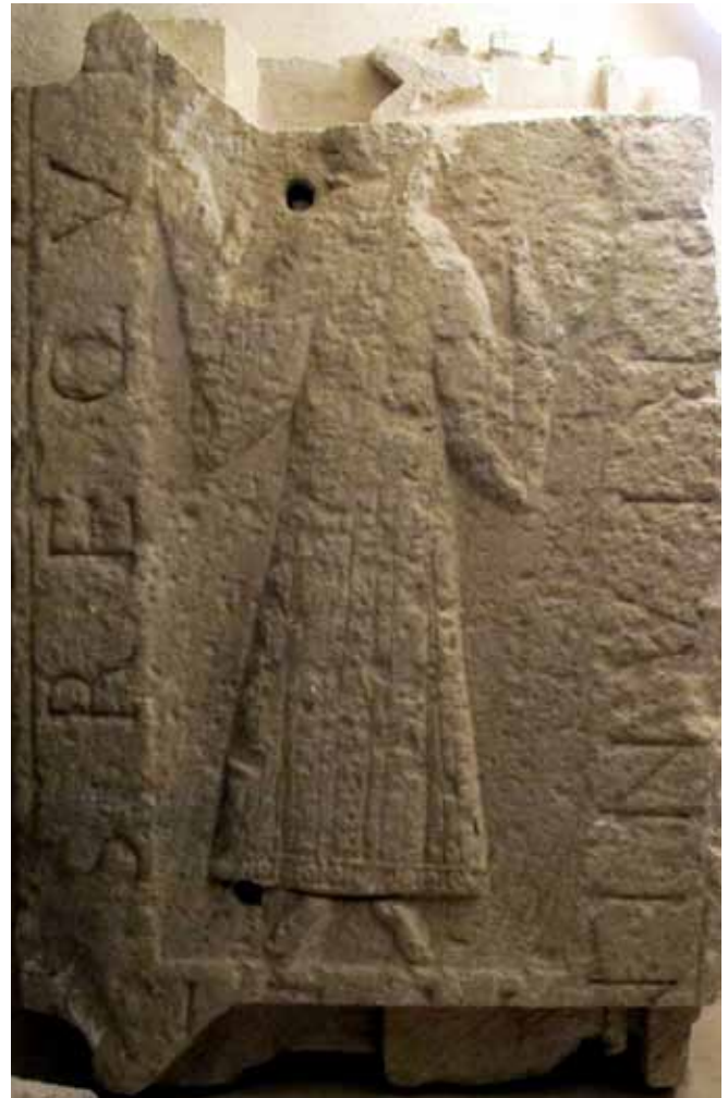
De vroegmiddeleeuwse gedachtenissteen toont een staande biddende figuur.

werking hadden besloten, volgde uiteindelijk in 2011 door een fusie de oprichting van de Protestantse Gemeente te Lochem. Met de overdracht van het godshuis aan de Stichting Oude Gelderse Kerken wordt een nieuwe fase in de geschiedenis van de Lochemse Grote Kerk ingezet.