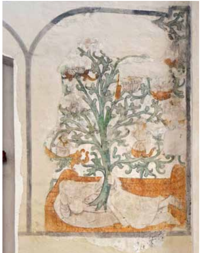
De Boom van Jesse verbeeldt de stamboom van Jesse. Zijn nakomelingen zijn op deze laatmiddeleeuwse schildering in de zuidbeuk afgebeeld tussen de boomtakken.

In 1976 kon de volledig gerestaureerde kerk weer voor de eredienst in gebruik worden genomen. Nadat de kerkenraden van de Nederlandse Hervormde Kerk en de Gereformeerde Kerk al in 1984 tot hereniging en samen-