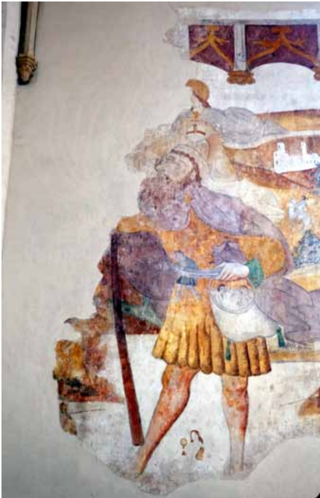
Afbeelding van Sint-Christoffel in de zuidbeuk. Het is een gemakkelijke voorstelling, met enkele medereizigers geklemd achter de riem van de reus, vissers op de rivieroever, een kleine meermin in het water en een fraai landschap op de achtergrond.