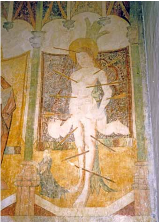
Muurschildering in de zuidbeuk, voorstellende Jacobus als pelgrim en de met pijlen doorboorde Sebastianus, beiden geplaatst onder een gotisch baldakijn. Bij het middenzuiltje is een biddend figuurtje te zien, vermoedelijk verwijzend naar de schenker of stichter van de schildering. Foto: CeesJan Frank, 2017

(requi(em), 'hij ruste') en ANIM (anim(a) of anim(am), 'ziel') en de voorstelling van de biddende persoon duiden op het oorspronkelijke funeraire gebruik als gedenksteen voor een overledene.