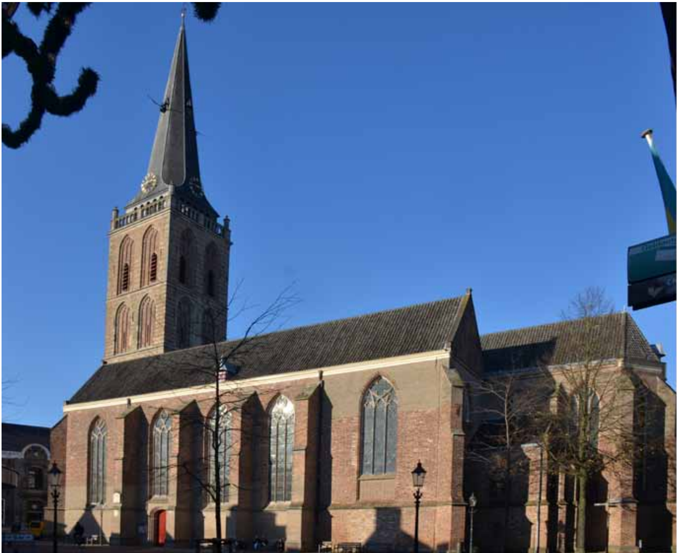
Het schip en zicht op het koor van de kerk.