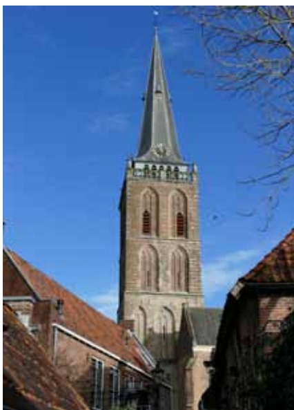
De rijk gelede laatgotische toren van de Grote Kerk dateert uit 1478.