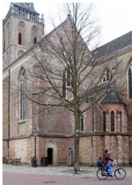
Zuidbeuk met zijkapel van het koor. Foto: Carel van Gestel, 2019