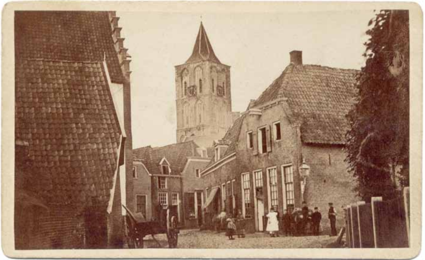
De Grote Kerk op een van de oudste foto's van het stadje Lochem, gemaakt rond 1870 in de Smeestraat. De toren heeft hier nog de lage bekroning, die in 1903 werd vervangen door een nieuwe hoge spits.

nog betrekkelijk veel in de huidige kerk terug te vinden. Allereerst de middenbeuk met de aansluitende viering en het hoofdkoor. Het lage zuidelijke zijkoor geeft nog een indruk van de basilicale opzet van de kruiskerk. Bij de opgraving in 1972 zijn veertiende-eeuwse muren van de zijbeuken teruggevonden. In de huidige scheibogen tussen middenschip en zijbeuken zijn nog de aansluitingen te zien van de verdwenen lichtbeukvensters van het basilicale schip. Van het dwarsschip resteren de viering, de zuidelijke transeptarm (met gewelf) en de noordwand.