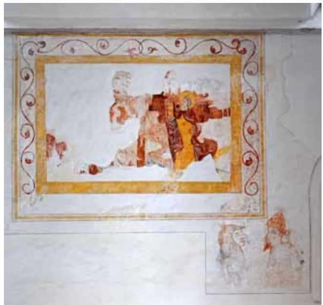
Wandschildering in de noordbeuk, met een fragment van de kruisiging. Rechts onder zestiende-eeuwse 'graffiti', een gehelmde figuur met sik bespuugt een man met zotskap. Mogelijk is deze tekening aangebracht tijdens de Spaanse belegering van Lochem in 1582.