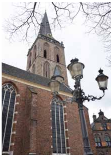
Zicht op de Gudulakerk vanuit het noorden.